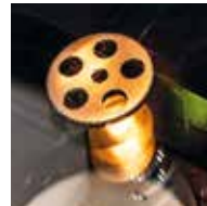
Metall-, Kunststoff- und Elektroindustrie