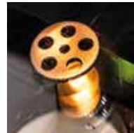
Metall-, Kunststoff- und Elektroindustrie